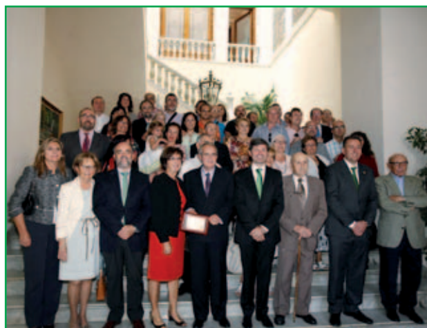
Valencià de l'Any