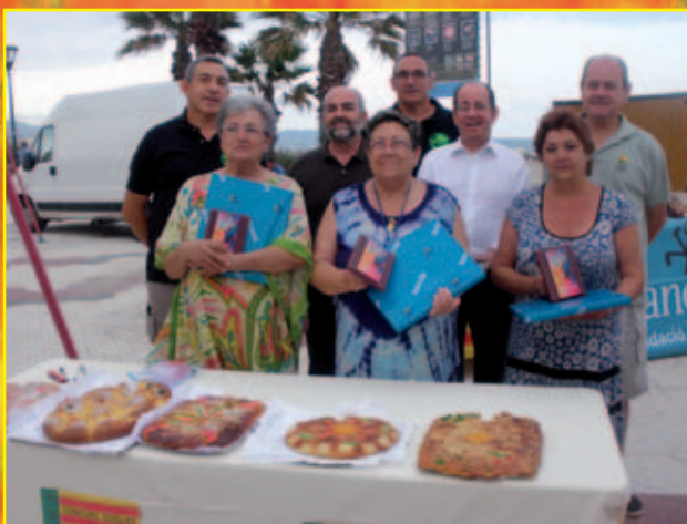
Concurs Coques de Sant Joan