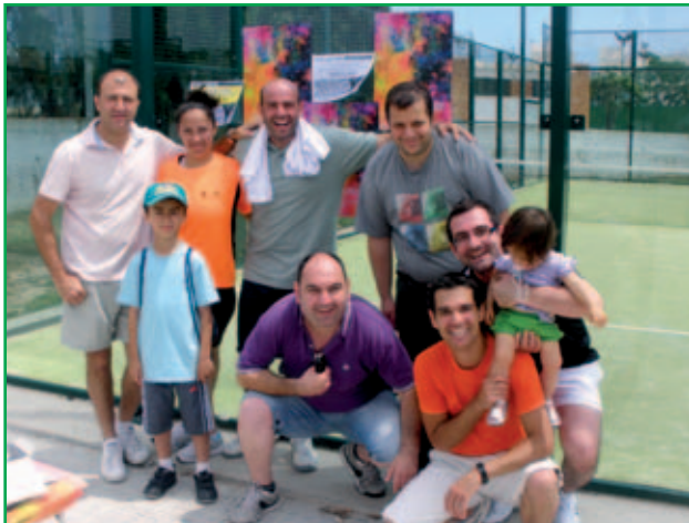
Pàdel Sant Joan 2011