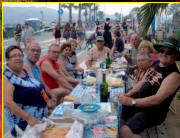
Nit de Sant Joan