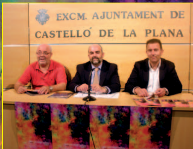
Roda de premsa