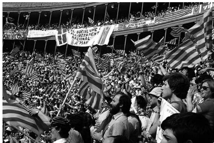
Acte polític a la plaça de toros de la ciutat de València al 1978

en defensa de de la llengua es va escampar per tot el País Valencià.