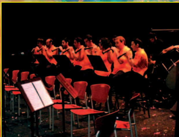
Concert per Sant Joan