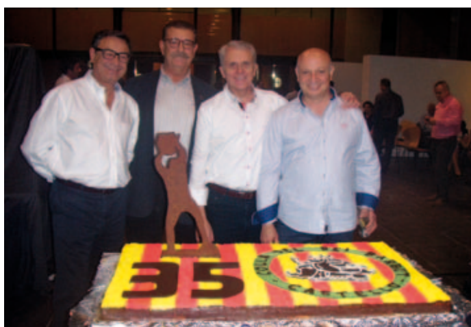
35 aniversari Rei Barbut