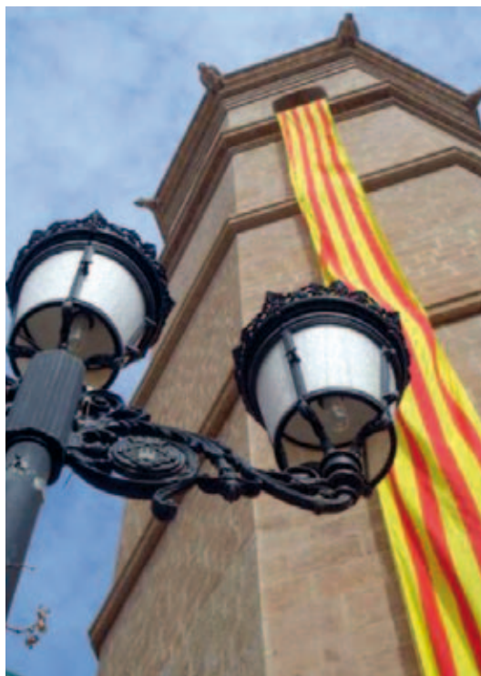
El Campanar de la Vila, el Fadri

Veig, i no sóc endeví, una difícil solució pels temes econòmics de les gaiates i implicació personal a les Comissions de Sector, veig més difícil encara aconseguir agilitat en els actes, major implicació i participació de les