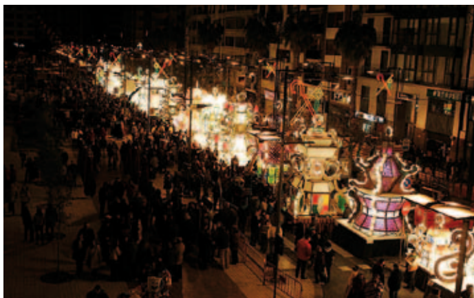
Encesa de Gaiates

registre corresponent. En els estatuts derogats la titularitat de la denominació gaiatera i els distintius corresponia a la Junta de Festes.