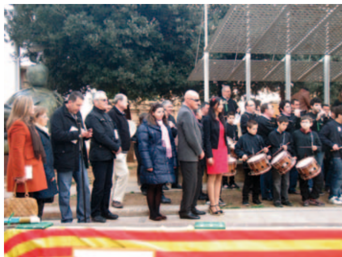
Madrines i autortitats

Escola Municipal de Dolçaina i Tabal de Castelló