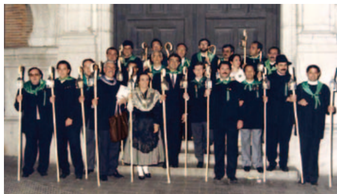
Junta de Festes 1989 - 1990