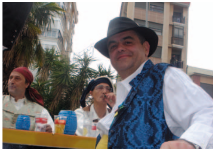
Pregó Magdalena 2011

La creació d'esta Junta de Festes, amb el concepte d'obertura i participació en l'organització i programació de la nostra setmana fundacional, va suposar sens dubte un revulsiu en el món de la festa de la nostra ciutat i ha contribuït en gran manera a l'auge que ha anat adquirint la nostra setmana magdalenera fins a convertir-se en una celebració de referència internacional. A això han contribuït també en gran manera les colles, que representen un element molt característic i determinant de les nostres festes. I va ser precisament sota el mandat d'aquella Junta de Festes quan les colles van iniciar el procés d'unió en una federació tal com havien fet uns mesos abans les comissions de sector amb la Gestora de Gaiates. L'auge de festa popular, de festa