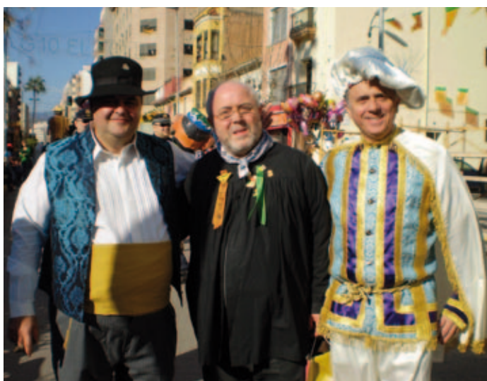
Pregó Magdalena 2008

Per tot això, em resulta especialment gratificant poder dedicar unes paraules a tots els amics i amigues de la Federació de Colles en estes festes de la Magdalena en què celebrem el primer quart de segle d'aquella Junta de Festes original en què vaig tindre la sort de participar i que va col·laborar sens dubte també en el protagonisme creixent que han tingut les colles en la nostra setmana gran. Estic convençut que este camí que portem transitant durant els últims 25 anys és pel qual hem de seguir i que per aquest veurem com les nostres festes adquirixen encara més brillantor i esplendor en el futur. Bones festes a tots els socis i sòcies de les Colles perquè sens dubte tots ells són grans protagonistes de les nostres festes més grans, les Festes de la Magdalena.