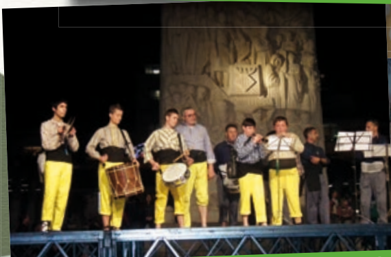
Homenatge de Castelló a la dolçaina i el Tabal