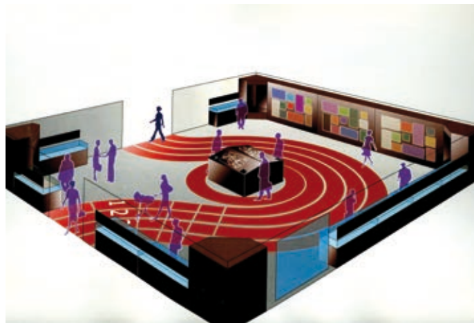
Panoràmica de la SALA 2 on s'exposaran cronològicament la història dels jocs i esports en les diferents civilitzacions

com l'Escola de Monitors de Jocs i Esports Tradicionals.