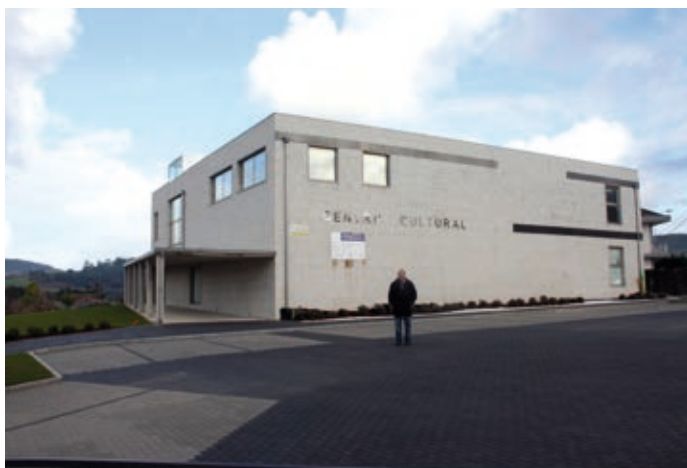
El President-Director, davant de l'edifici, on s'instal·larà el MELGA

En la sala 2, s'exposaran cronològicament els jocs i esports desenvolupats per l'home des de la prehistòria fins a l'actualitat, atenent a la seua evolució històrica i a la seua presència en les diferents civilitzacions antigues, fent especial referència als jocs i esports actuals, així com els Jocs Olímpics antics i moderns i, com en la sala anterior, completarà l'exposició una galeria de campions gallecs mundials, olímpics o paralímpics. Fins avui el nombre de peces catalogades ronden la xifra de 4.000, provinents en la seua major part dels fons de la Fundació Ricardo Pérez i Verdes. En aquesta planta és on actualment se situen la biblioteca, despatxos, sala d'informàtica, sala d'audiovisuals i sala de conferències, i on pròximament estarà el centre de documentació i recerca del MELGA, així