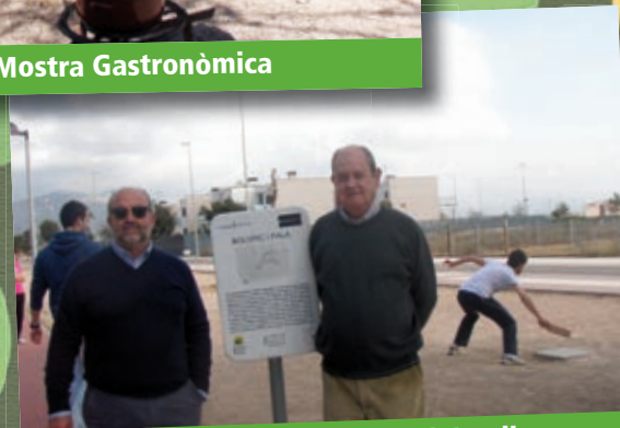
XXIV Campionat Mundial Boli