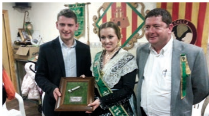
Lliurament Masclat d'Argent 2013 - A Mitges

Xarxa Teatre també va explicar anècdotes de les seues últimes experiències en països de l'estranger on han portat els seus espectacles i en els quals han hagut d'emprar material de producció local, la qual cosa els ha permès conèixer al detall les grans diferències existents entre la indústria pirotècnica en