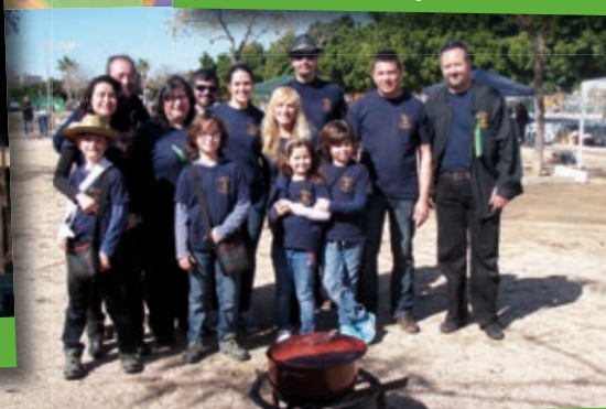
IV Mostra Gastronòmica