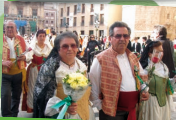
Ofrena a la Lledonera