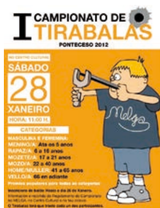
Cartell I Campionato Tirabalas Ponteceso 2012