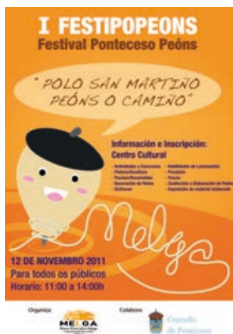
Cartell I FESTIPEPEONS Festival Ponteceso Peóns 2011

Esperem molt aviat la vostra visita. Estem segurs que ni MELGA ni nosaltres us defraudarem.