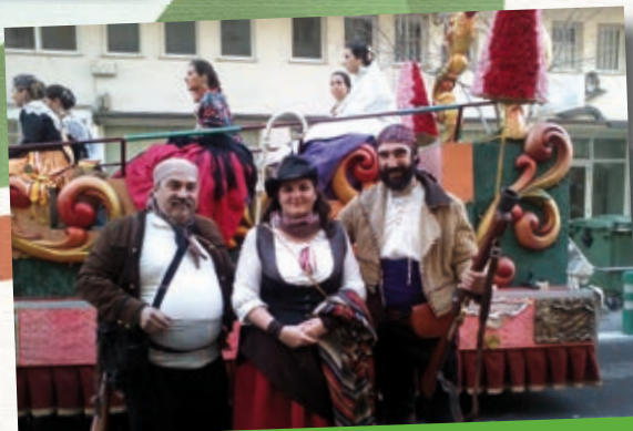
Amunt els trabucs