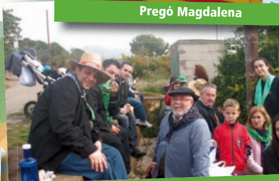
Romeria de les Canyes