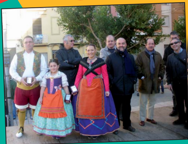
Gaiata 4 L'Armelar