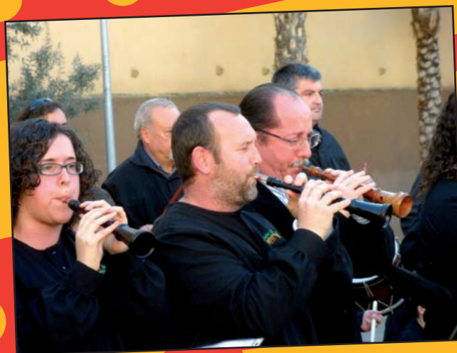
Moment de la Trobada 2011