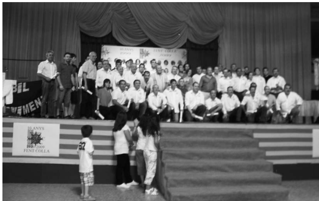
La Pèrgola, Xaloc al complet en la festa del X Aniversari de la colla

E n la Colla Xaloc hem arribat al butlletí nº 50, publicació que, a més de mostrar en la nostra pàgina web ( www.collaxaloc.com ), remetem periòdicament per correu electrònic a qualsevol persona que ho sol·licite, especialment aquelles entorn del món de la festa.