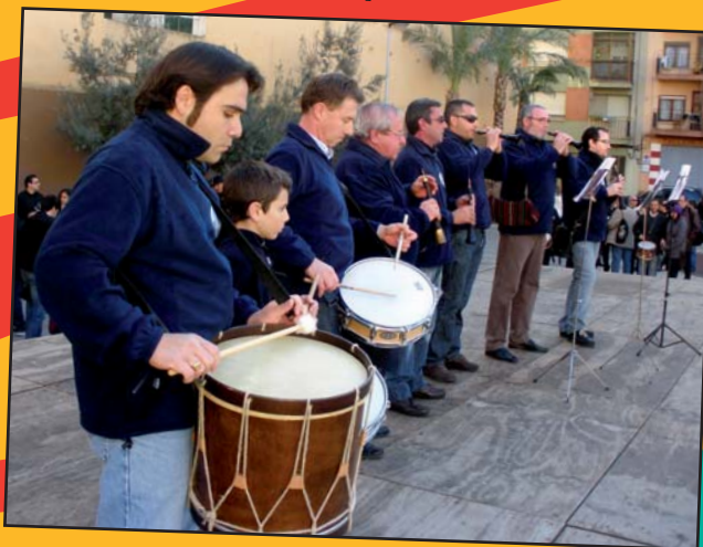
La Colla del Grau