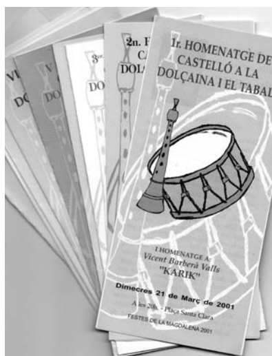
Tríplics Homenatge de la Ciutat de Castelló a la dolçaina i el tabal

Cal dir també que mostrem temes sobre el món dels trabucaires o arcabuseria de festa: Monogràfics sobre indumentària i equip dels trabucaires que representem, amb l'objectiu d'adaptar-se el més fidelment possible a l'època que representem (començaments del