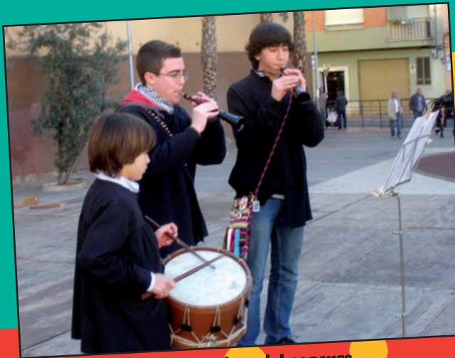
Els guanyadors del concurs